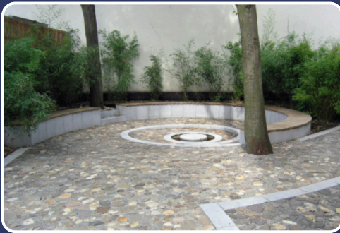
Psychosoziales Zentrum für Flüchtlinge Düsseldorf e.V. (2011)

Unser Trauerort soll sich sowohl „nach innen“ als auch „nach außen“ richten. Das heißt, er soll einerseits der notwendigen Trauerbewältigung der einzelnen Personen dienen, aber auch als mahrender Appell an die Zivilgesellschaft verstanden werden.