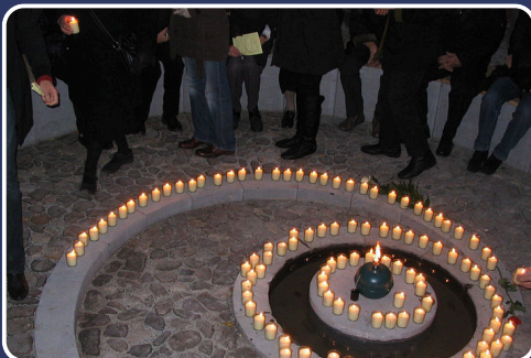
Psychosoziales Zentrum für Flüchtlinge Düsseldorf e.V. (2011)