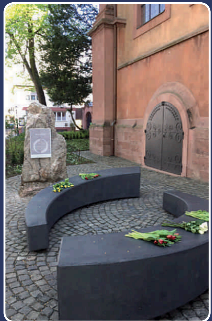
Psychosoziales Zentrum für Flucht und Trauma des Caritasverband Mainz e.V. (2018)